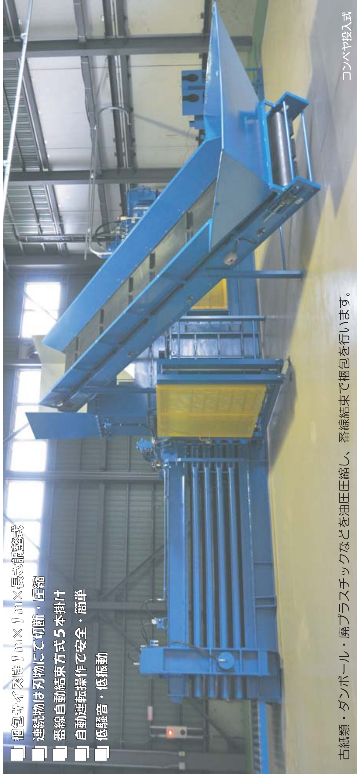
古紙類・ダンボール・廃プラスチックなどを油圧圧縮し、番線結束で梱包を行います。